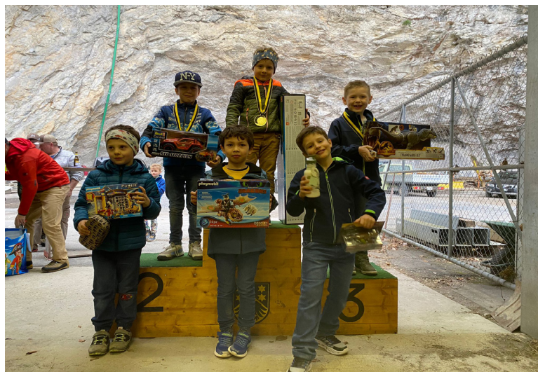
Buben 1. - 3. Klasse

Die Pfüderis wurden wie jedes Jahr mit dem Skidoo zum Start gebracht, was für die jüngsten Teilnehmer ein weiteres wunderbares Erlebnis war. Zudem wurden sie links und rechts der Rennpiste von Zuschauern