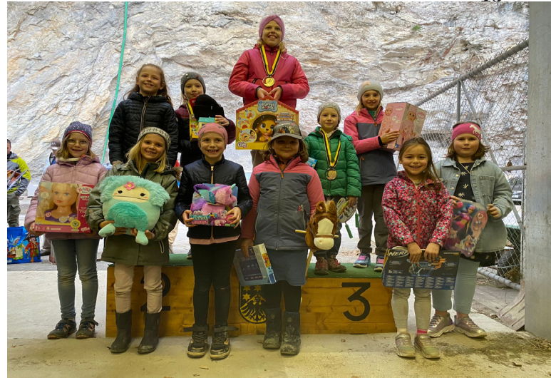
Mädchen 1. - 3. Klasse

Der alljährliche Höhepunkt in der Agenda der Schattenhalb Kinder, fand so einen gelungenen Abschluss. Und man war/ist sich einig, dass dieser einzigartige Anlass für die Schattenhalb Kinder, auch im nächsten Jahr nicht fehlen darf.