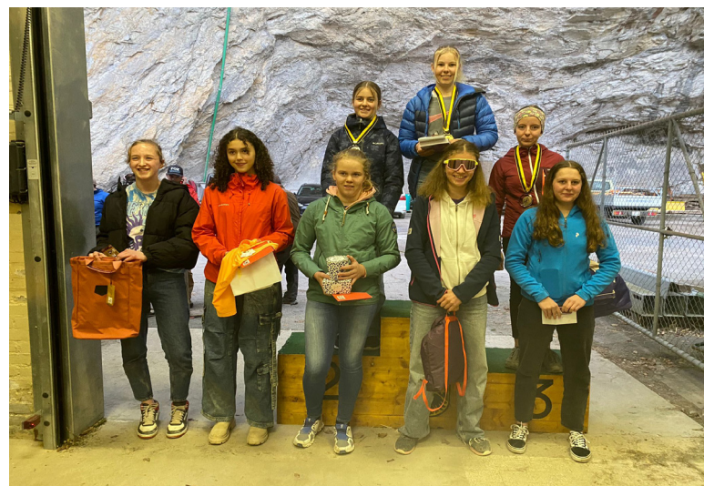
Mädchen 7. - 9. Klasse