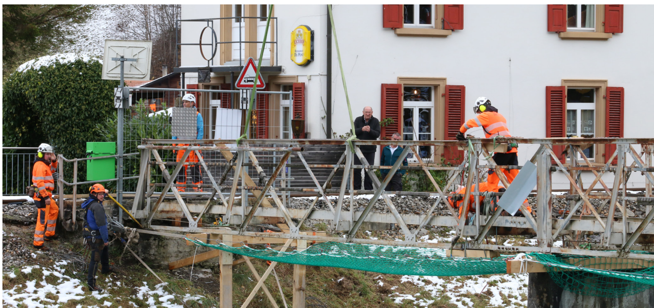
Der Sandsteg wurde Ende November 2023 abgebaut; ein Ersatz wird wohl geplant werden.

Am 13. Mai fand die abschliessende Programmsitzung statt. Es ging darum, das Wettbewerbsprogramm zu besprechen und zu beschliessen. Nun haben die eingeladenen Planungsteams die Unterlagen und das unterzeichnete Wettbewerbsprogramm. Sie können Fragen an das Wettbewerbssekretariat richten und mit der Projektierungsaufgabe starten.