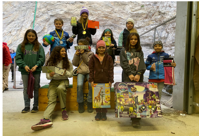
Mädchen 4. - 6. Klasse