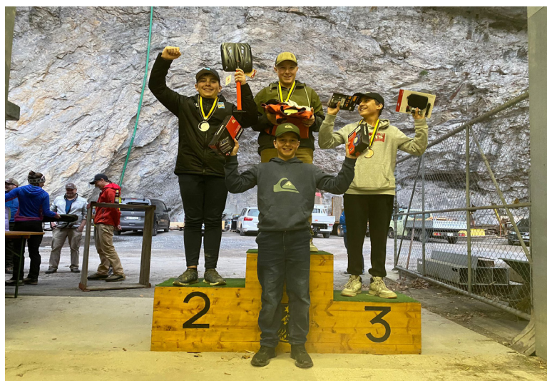
Buben 7. - 9. Klasse