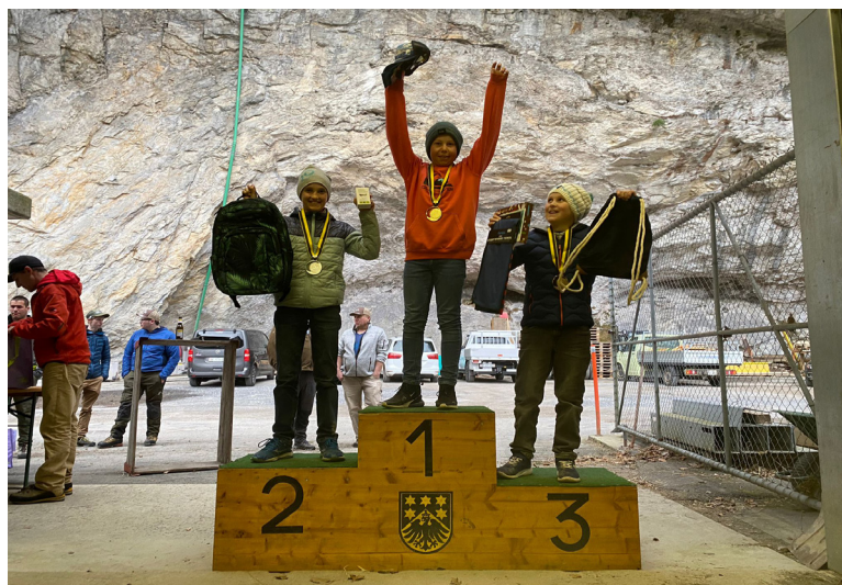
Buben 4. - 6. Klasse